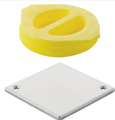
Figura di esempio